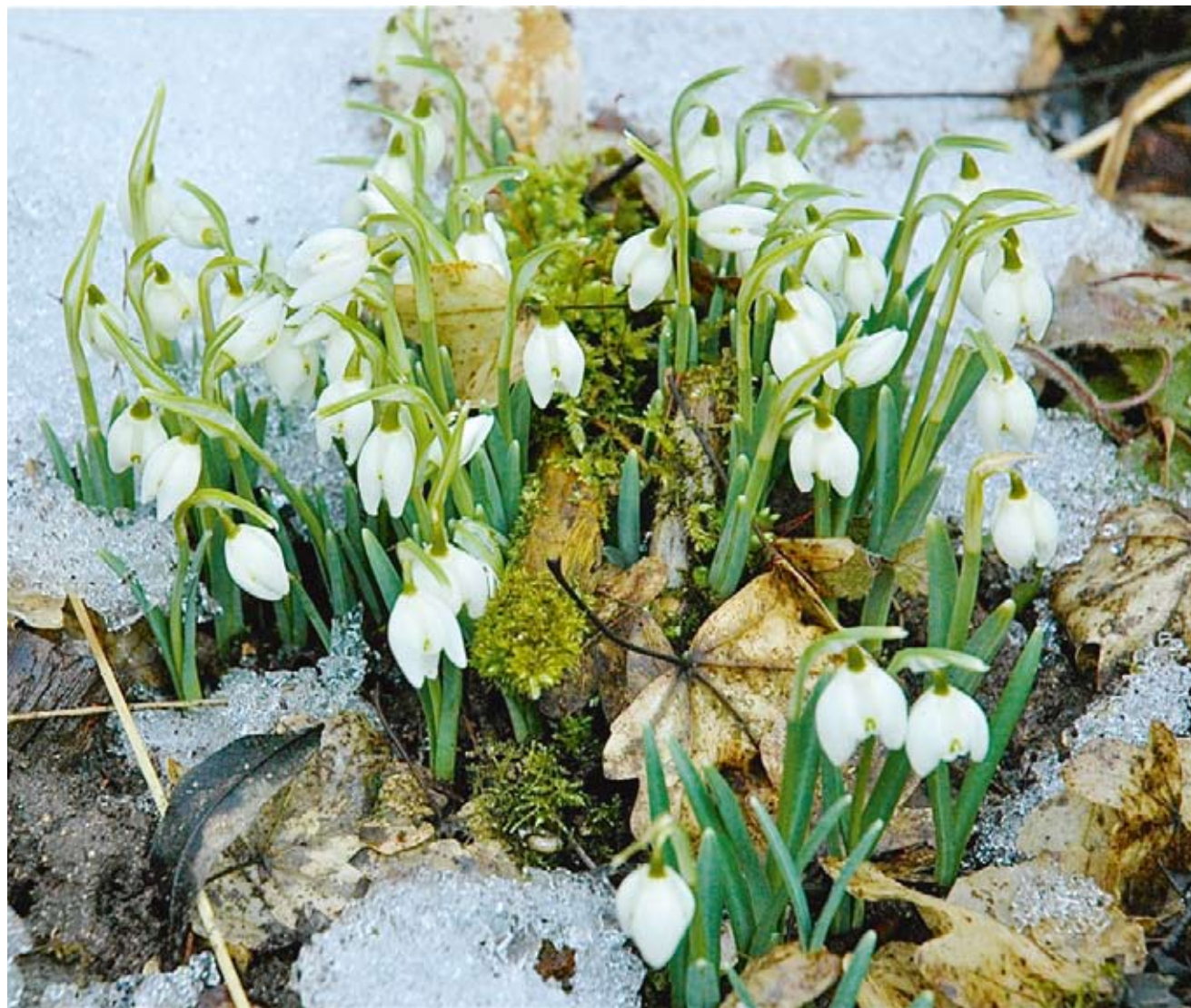
Elles portent bien leur nom les perce-neige (Galanthus nivalis) / fc

CET EMPLACEMENT EST RÉSERVÉ POUR VOTRE ANNONCE